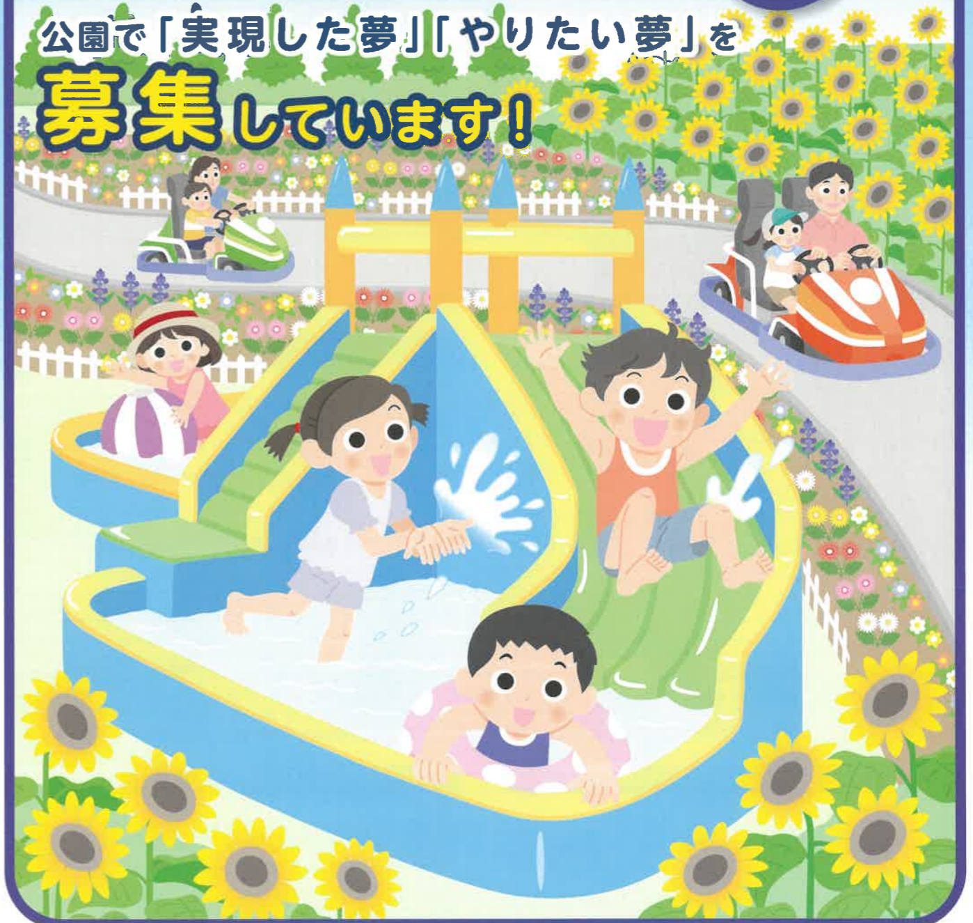
2023年に最優秀賞を受賞した『週末の公園は子育て家族のテーマパーク』をイメージした絵です